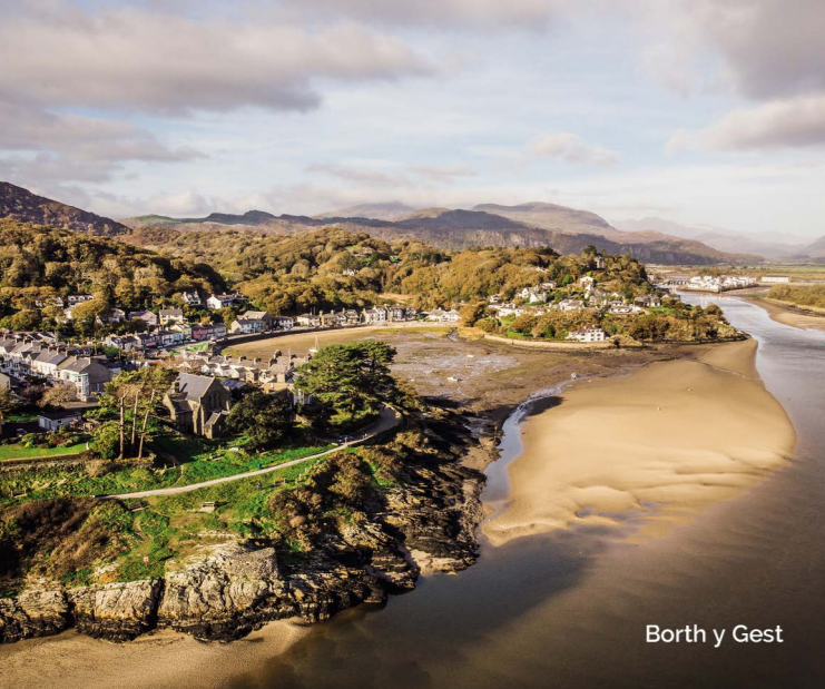
Borth y Gest